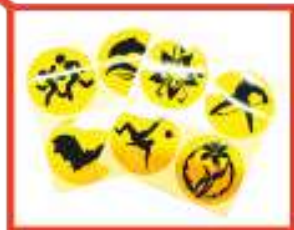
наклейки и значки