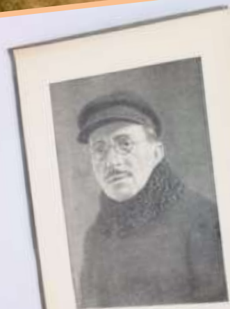
А. С. Макаренко (1868—1939)

в которой до мельчайших подробностей знакомит читателя с собственными взглядами на воспитание подрастающего поколения. Педагог придерживался мнения, что ребенку нужен коллектив, иначе он не будет адаптирован в социуме. Однако, он писал и о необходимости каждого индивида в свободной реализации. Еще одним неизменным условием гармоничного роста и развития личности Макаренко считал трудовую деятельность. Все воспитанники талантливого педагога сами зарабатывали себе на жизнь.