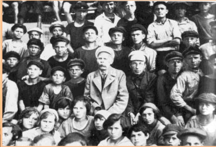
Воспитанники колонии им. Горького с А. М. Горьким и А. С. Макаренко

По официальным данным, из более чем трёх тысяч беспризорников, воспитанных под руководством Макаренко, ни один не вернулся в тюрьму. Многие выросли в квалифицированных рабочих, другие получили высшее образование и стали экономистами, управленцами и учителями.