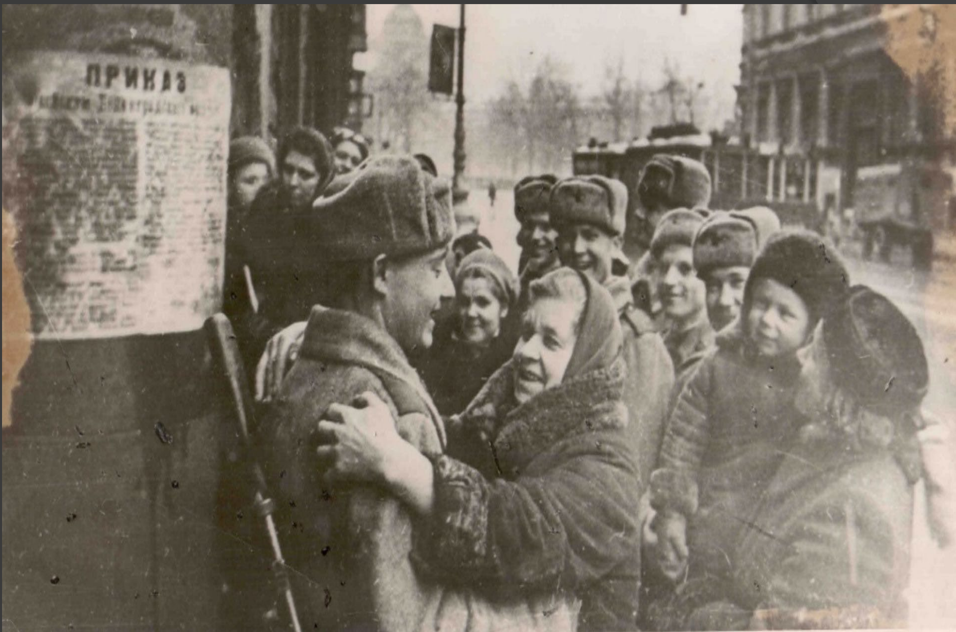
«Город Ленинград освобожден»